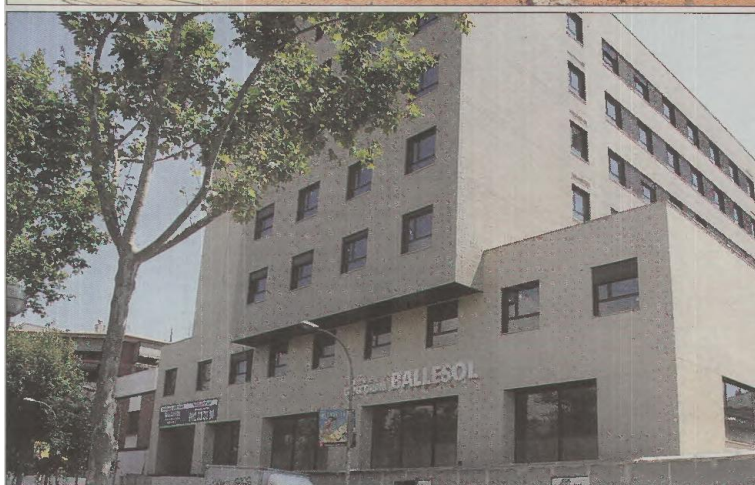
Arriba, fachada de la nueva residencia Balesol Badalona. Abajo, el nuevo centro de la calle de Almogàvers en Barcelona.